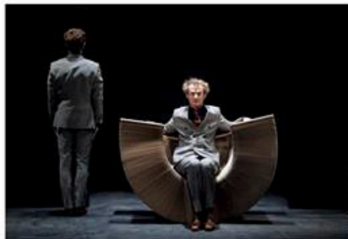
« Cloc », le premier spectacle de la compagnie « 32 novembre », est programmé jusqu'à samedi aux Subsistances (1 er ).

Les deux complices de la jeune compagnie « 32 novembre » dévoilent à partir de ce soir leur premier spectacle, « Cloc », une « pièce pour deux magiciens » qu'ils ont en partie mûrie aux Subsistances. S'ils citent volontiers Méliès ou Houdini en référence et sont parfaitement capables de monter un numéro de dix minutes pour épater le jury lors des championnats du monde de magie, les deux artistes aspirent désormais surtout à déployer leur propre univers dans la durée. « On s'inspire du patrimoine magique qu'on respecte mais on cherche une forme d'originalité », résument les deux fondateurs de la compagnie. « On s'est retrouvés autour d'un style commun, assez épuré et dépouillé, dans un milieu où les effets sont parfois chargés ».