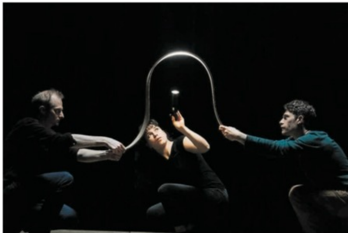
Compagnie 32 Novembre betoverde het publiek met verbluffende magie.

Op puinbergje werd vervolgens nauwkeurig ontmanteld en keurig klaargezet door drie mannen en twee vrouwen, terwijl man nummer vier zich bekommerde om het alvast dreigende geluid. Het leek er op dat de helft van die groepsleden achteloos uit het publiek was ge-